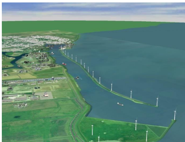
Situatieschets windmolenpark Delfzijl

Het zand is afkomstig vanaf de Duitse Eems, waardoor het zand zo dicht mogelijk bij het werk kan worden gewonnen. Hierdoor is er een kleine vaarafstand en dus geringe CO 2 -uitstoot. Dit windmolenpark zal volgens berekeningen van Eneco zo'n 60.000 huishoudens voorzien van stroom.